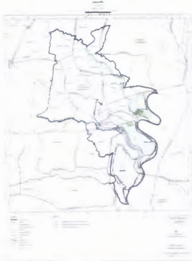
แผนผังแสดงที่ตั้ง