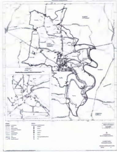
แผนผังแสดงโครงการกิจการสาธารณูปโภค สาธารณูปการ และบริการสาธารณะ ลักษณะ ๒