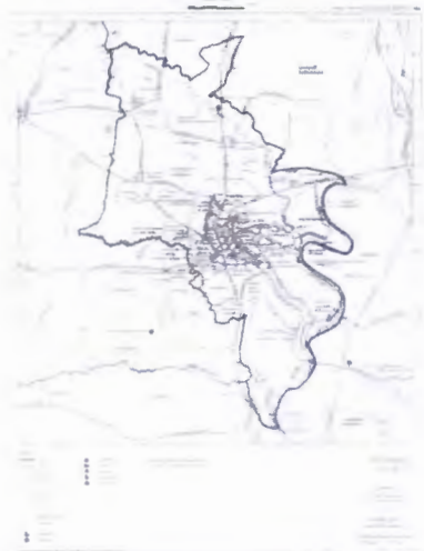
สาธารณูปการ และบริการสาธารณะ ลักษณะ ๑