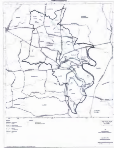
แผนผังแสดงแหล่งทรัพยากรธรรมชาติและ สิ่งแวดล้อม

พิกัด: ๑๓°๑๖'๓๖.๖๖๖" เหนือ ๑๐๐°๑๖'๓๖.๖๖๖" ตะวันออก