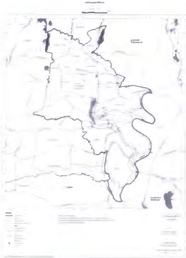
แผนที่แสดงเขตของผังเมืองรวม