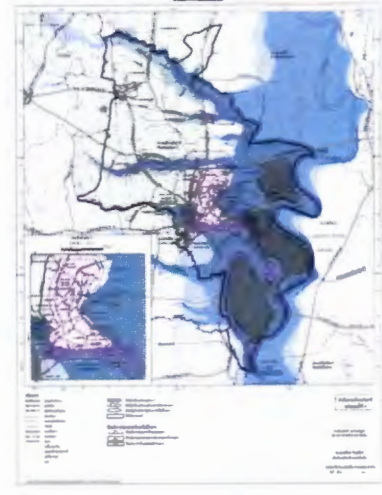
แผนผังแสดงผังน้ำ

ทั้งนี้ ขอให้ประชาชนในท้องที่ดังกล่าวเข้าร่วมประชุมรับฟังความคิดเห็น ในวัน เวลา และสถานที่ ตามที่กำหนด และแสดงความคิดเห็นด้วยวาจาในวันที่มีการประชุม รับฟังความคิดเห็นกับประชาชนตามที่กำหนดไว้ข้างต้นนี้ หรือแสดงความคิดเห็นเป็นหนังสือ หรือแสดงความคิดเห็นทางเว็บไซต์ของกรมโยธาธิการและผังเมือง (www.dpt.go.th) รวมทั้ง มีหนังสือแสดงความคิดเห็นเพื่อให้มีผลเกี่ยวกับสิทธิของตน เพื่อเป็นหลักฐานประกอบในการยื่น คำร้องขอให้แก้ไข เปลี่ยนแปลง หรือยกเลิกข้อกำหนดการใช้ประโยชน์ที่ดินในขั้นตอน การปิดประกาศเป็นเวลาไม่น้อยกว่าเก้าสิบวันตามมาตรา ๓๐ วรรคสอง แห่งพระราชบัญญัติ การผังเมือง พ.ศ. ๒๕๖๒ ตั้งแต่วันที่ ๖ - ๒๒ กันยายน ๒๕๖๖ ซึ่งสามารถขอหนังสือแสดงความคิดเห็นได้ที่กรมโยธาธิการและผังเมือง สำนักงานโยธาธิการและผังเมืองจังหวัดอุทัยธานี สำนักงานเทศบาลเมือง อุทัยธานี สำนักงานเทศบาลตำบลหาดทอง ที่ทำการองค์การบริหารส่วนตำบลเนินแจง ที่ทำการองค์การบริหาร ส่วนตำบลหนองไผ่แบน ที่ทำการองค์การบริหารส่วนตำบลหนองแก ที่ทำการองค์การบริหารส่วนตำบลคอนขาง ที่ทำการองค์การบริหารส่วนตำบลสะแกกรัง ที่ทำการองค์การบริหารส่วนตำบลเกาะเทโพ ที่ทำการองค์การ บริหารส่วนตำบลน้ำซึม ที่ทำการองค์การบริหารส่วนตำบลท่าซุง หรือดาวน์โหลดได้ที่เว็บไซต์ของกรมโยธาธิการ และผังเมือง (www.dpt.go.th)