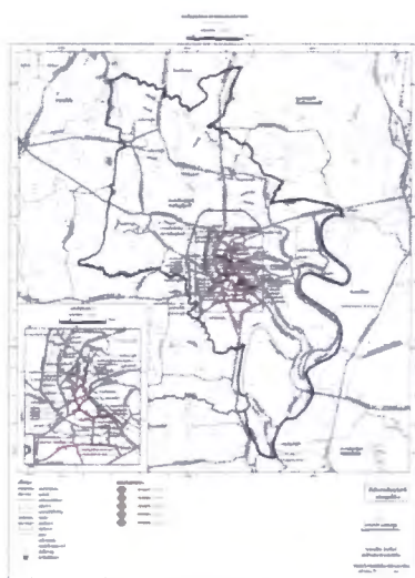
แผนผังแสดงโครงการการคมนาคม และการขนส่ง