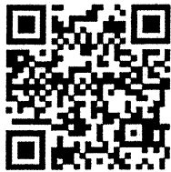
QR Code สำหรับลงทะเบียน

ขั้นตอนที่ 2 กรอกข้อมูลให้ครบถ้วน แล้วกดปุ่ม “ลงทะเบียน”