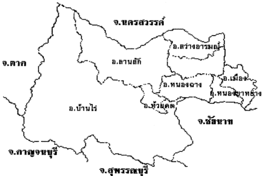
รูปที่ ๑ แผนที่แสดงที่ตั้งและอาณาเขต