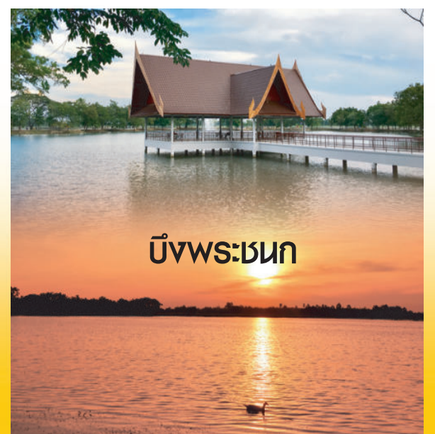
บึงพระเชนก

โทร (056) 511367 Fax : (056) 511297 www.uthaipao.go.th