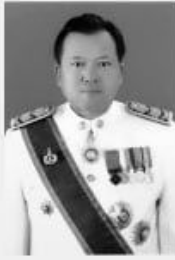
นายพิเชฐ ตันโทภาส รองผู้อำนวยการจังหวัดอุทัยธานี

เกิดวันพุธที่ 26 ธันวาคม 2505 ณ กรุงเทพมหานคร