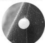
ไข่ มีลักษณะคล้ายหยดน้ำ สีเหลืองอมเขียวใส

ตัวเต็มวัย เป็นผีเสื้อกลางคืนขนาดเล็กมาก ความกว้างเมื่อกางปีกออกทั้งสองข้างประมาณ 6.0 - 8.0 มิลลิเมตร ลำตัวสีน้ำตาลแวววาว เพศเมียวางไข่เป็นฟองเดี่ยวๆ บริเวณใกล้เส้นกลางใบ ส่วนใหญ่จะพบต้นได้ใบมากกว่าต้นบนใบ