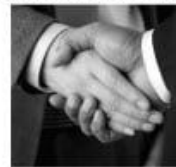
โดย นายอรรถพล ขุฒเภา : นิติกร สำนักงานอัยการ

ที่กล่าวมาเป็นการประนอมข้อพิพาทโดยคณะกรรมการหมู่บ้าน ซึ่งปัจจุบัน คณะกรรมการหมู่บ้าน มีอยู่ทุกหมู่บ้านในประเทศไทย และผมเข้าใจว่าตัวคณะกรรมการหมู่บ้าน ก็รู้เรื่องอำนาจหน้าที่ในเรื่องนี้ แต่การดำเนินการประนอมข้อพิพาทไม่ค่อยได้ปรากฏเป็นลายลักษณ์อักษร แต่เข้าใจว่าคณะกรรมการหมู่บ้านได้ดำเนินการอยู่ นี้ก็เป็นช่องทางหนึ่งของการยุติข้อพิพาทที่เกิดขึ้น หากพี่น้องประชาชนเกิดข้อพิพาทขึ้นในหมู่บ้านจะเป็นการระงับข้อพิพาทที่เสียค่าใช้จ่ายน้อยที่สุด เพราะไม่ต้องเดินทางไปร้องขอความช่วยเหลือที่โดยอย่างน้อยก็ประพจน์ค่าใช้จ่ายในการเดินทางครับ