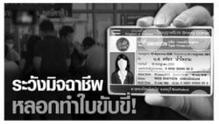
ระวังมิจฉาชีพหลอกทำใบขับขี่!

รถยนต์สามล้อสาธารณะ, รถจักรยานยนต์สาธารณะ) จำนวน 3 ชั่วโมง เพิ่มความสะดวก ลดขั้นตอนและลดระยะเวลาในการติดต่อต้นเป็น จึงขอให้ประชาชนอย่าหลงเชื่อหากมีผู้ใดแอบอ้างอาสาดำเนินการด้านใบอนุญาตขับรถให้โดยเด็ดขาด หากประชาชนพบเห็นบุคคลใดมีพฤติกรรมไม่น่าไว้วางใจหรือได้รับการติดต่ออาสาดำเนินการแทน สามารถแจ้งเจ้าหน้าที่เพื่อให้ความช่วยเหลือประชาชนได้ทันทีที่ โทรหรือสายด่วน 1584 ตลอด 24 ชั่วโมง