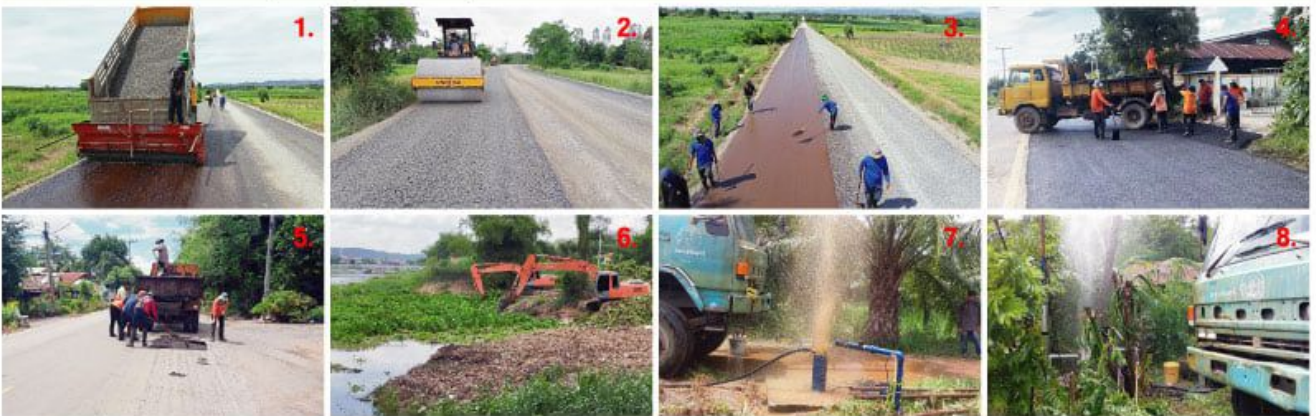
(1-3) อบจ.อุบลราชธานี ส่งเครื่องจักรกลชุดลาดยางพร้อมเจ้าหน้าที่ปฏิบัติงานซ่อมสร้างถนนลาดยาง Cape Seal ถนนสายบ้านหนองข่าย่าง-บ้านหนองโรง อำเภอหนองข่าย่าง และสายบ้านหนองขาม-บ้านดอนสวีตี้ อ.บ้านไร่ จ.อุบลราชธานี (4-5) อบจ.อุบลราชธานี นำเครื่องจักรกลพร้อมเจ้าหน้าที่เข้าปรับปรุงซ่อมแซมถนนสายแยกทางหลวงหมายเลข 333 - บ้านหนองพังค่า อ.เมือง และถนนสายแยกทางหลวงหมายเลข 3211 - บ้านจัน อ.บ้านไร่ จ.อุบลราชธานี (6) องค์การบริหารส่วนจังหวัดอุบลราชธานี ดำเนินการกำจัดผักตบชวาและวัชพืชในแม่น้ำสะแกกรังบริเวณสะพานพัฒนาภาคเหนือถึงวัดอุโปสถาราม ระหว่างวันที่ 4 - 18 กันยายน 2563 โดยใช้เครื่องจักรกลพร้อมเจ้าหน้าที่เข้าดำเนินการ (7-8) อบจ.อุบลราชธานี ดำเนินการเป่าล้างบ่อน้ำบาดาลและซ่อมบำรุงบ่อ บริเวณ ม.4 ต.โคกหม้อ อ.พิบูลย์ และ ม.8 ต.หนองไผ่ อ.หนองข่าย่าง จ.อุบลราชธานี เพื่อบรรเทาความเดือดร้อน